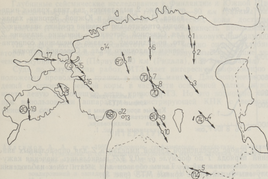
Рис. 1. Ориентация больших осей теллурических эллипсов (стрелки) и глубина залегания проводящего слоя верхней мантии (цифры в кружках, км).

1 — Мядапэ, 2 — Рахкла, 3 — Алавере, 4 — Ярве, 5 — Харгла, 6 — Арду, 7 — Тюри, 8 — Коксвере, 9 — Савикоти, 10 — Нуйа, 11 — Ярваканди, 12 — Пярну, 13 — Лодья, 14 — Нисси, 15 — Ридала, 16 — Лихула, 17 — Палукуюла, 18 — Ванамыйза, 19 — Каарма.