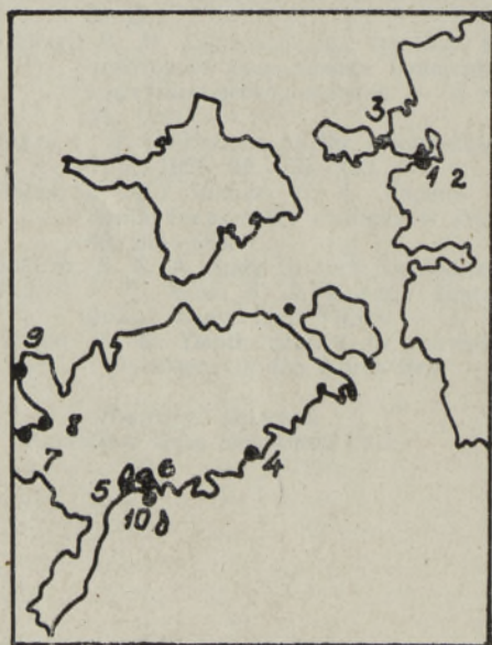
Рис. 1. Схема расположения изученных месторождений морских лечебных грязей. 1 — Тагалахт (Хаапсалу); 2 — Вяйке-Вийк (Хаапсалу); 3 — Воози; 4 — Сийксааре; 5 — Суурлахт; 6 — Линнулахт; 7 — Кийрассааре; 8 — Абая; 9 — Юнкрулахт; 10 — Курессааре.

Нами определено содержание БП в лечебных грязях следующих месторождений: Хаапсалу, Воози, Сийксааре, Суурлахт, Линнулахт, Кийрассааре, Абая, Юнкрулахт и Курессааре (рис. 1). Пробы лечебной грязи отбирали в феврале—марте 1981 и 1982 гг. со льда болотным буром белорусского типа и упаковывали в стеклянные банки. В лаборатории проанализированы 54 пробы. Подготовку проб к анализу с целью количественного определения БП проводили общеприня-