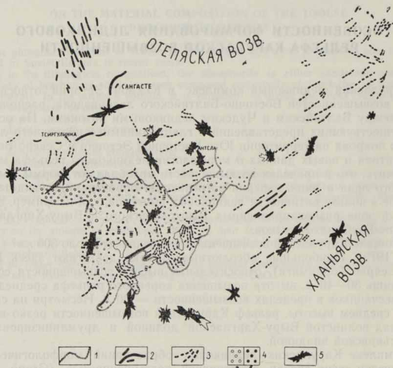
Рис. 1. Геоморфологическая схема Карулаской возвышенности: 1 — граница возвышенности; 2 — формы активного ледника (друмлины, конечные морены); 3 — унаследованно-ориентированный рельеф мертвого льда; 4 — беспорядочно расположенный холмистый рельеф мертвого льда: а — холмы и гряды с моренной покрывкой, б — камы; 5 — ориентировка галек в морене.

Согласно геоморфологической схеме (рис. 1) Карулаской возвышенности и территорий соседних гляциодепрессий, формы рельефа в зависи-