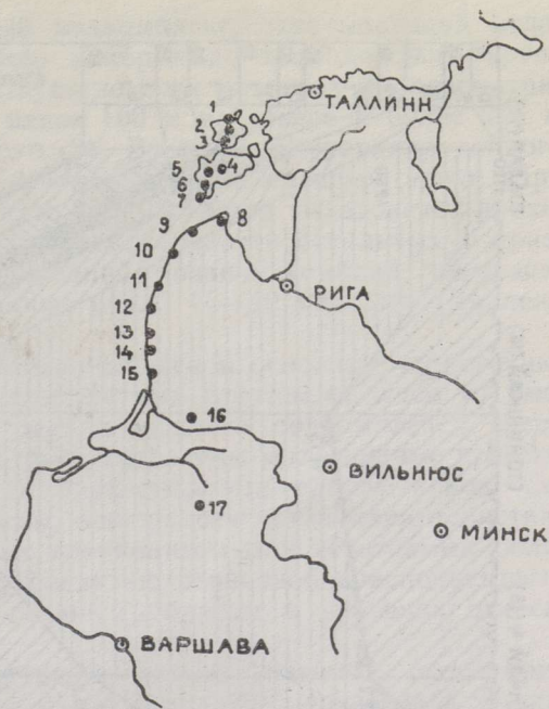
Fig. 1. Location of the borings shown in Figs. 2—5.

Скважины: 1 — Тахкуна, 2 — Курису, 3 — Эммасте, 4 — Эйкла, 5 — Вики, 6 — Каугатума, 7 — Охесааре, 8 — Колка 54, 9 — Овиши, 10 — Вентспилс, 11 — Павилоста, 12 — Лиепая, 13 — Бернаты 53, 14 — Папе 95, 15 — Генчай 4, 16 — Стонишкяй, 17 — Голдап.