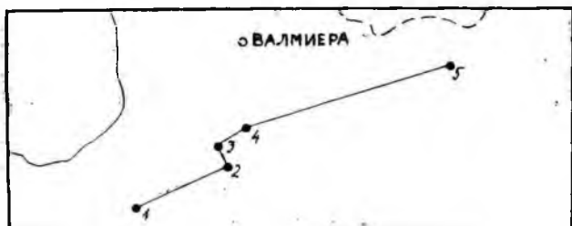
Рис. 1. Расположение буровых скважин: 1 — Балдоне, 2 — Таурупе, 3 — Нитауре, 4 — Дзербене, 5 — Алуksне.

Автору настоящей статьи предоставилась возможность летом 1972 г. принимать участие в составе экспедиции Института геологии АН ЭССР в Латвии и ознакомиться более подробно с керном буровых скважин Балдоне, Дзербене и Алуksне (рис. 1.), а также получить представление о литологии порку-