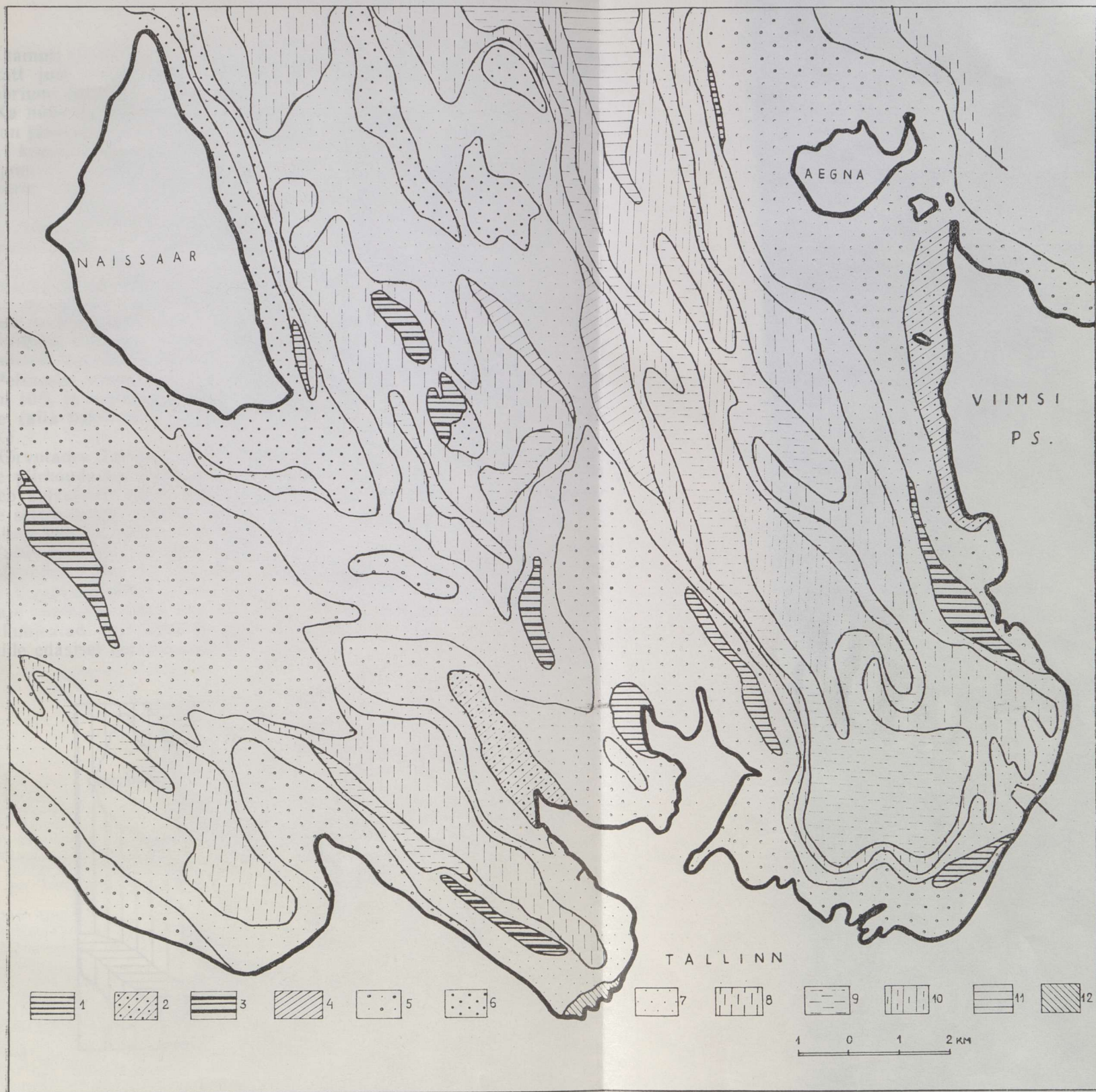
Joon. 1. Setendid Tallinna lahe põhjas. 1 — kambriumi settekivimid, 2 — moreen, 3 — hilisjäaaegsed järvesavid, 4 — jääajajärgsed järvesavid; 5—12 — nüüdissetted: 5 — jäänukssetted, 6 — keskmine ja jäme liiv, 7 — peen liiv, 8 — jäme aleuriit, 9 — peen aleuriit, 10 — aleuriitpeliit, 11 — peliit, 12 — peeneteraliseid orgaanikarikkad setted (muda).