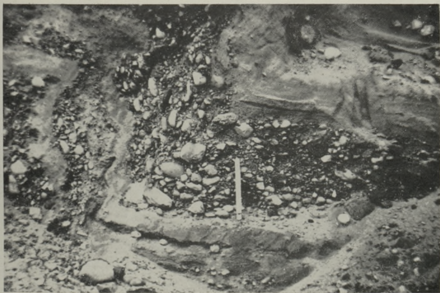
Рис. 3. Нарушения слоистости, вызванные таянием погребенного льда во флювиогляциальных отложениях Ногопалуского кама (Хааньяская возвышенность).