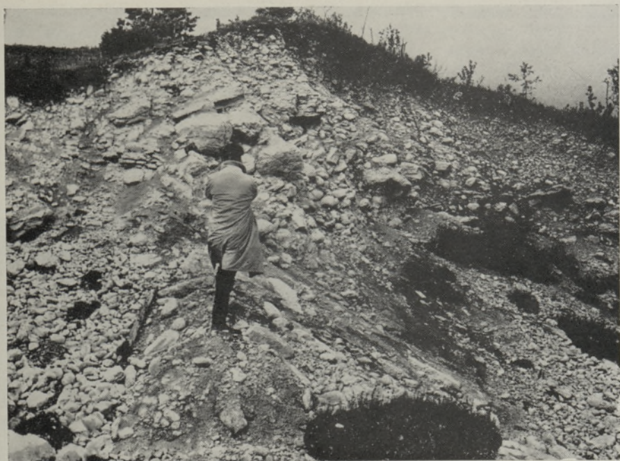
Рис. 2. Характерные для радиальных озв Северной Эстонии слабоотсортированные грубообломочные флювиогляциальные отложения оза Клинге (Пандиверская возвышенность).