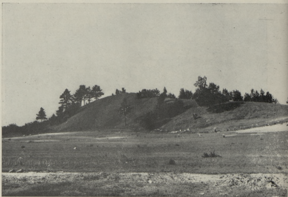
Рис. 4. Оз «кометового» типа близ Улясте.