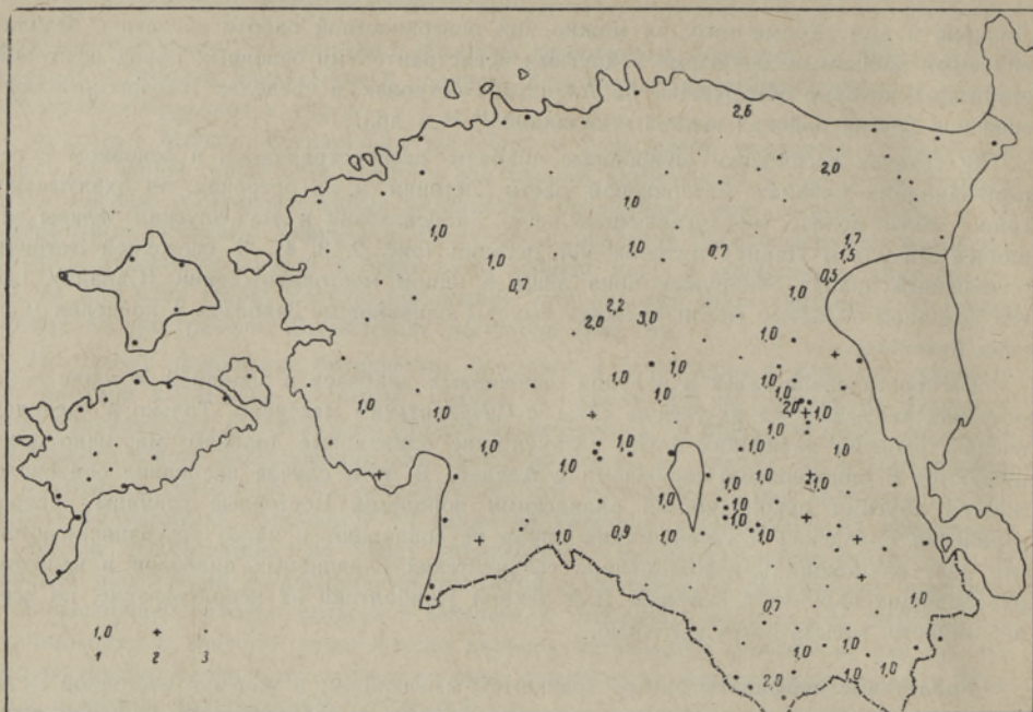
Рис. 5. Содержание хельсинкигов в галечной фракции морен последнего оледенения Эстонии. 1 — содержание в % от кристаллических пород; 2 — хельсинкиты встречаются в очень незначительном количестве или содержание их точно не установлено; 3 — хельсинкиты отсутствуют.

ограниченное распространение и исходные районы их точно не установлены, мы не считаем их руководящими валунами, но в то же время не отрицаем возможности их использования. Этот вопрос требует дальнейшего уточнения.