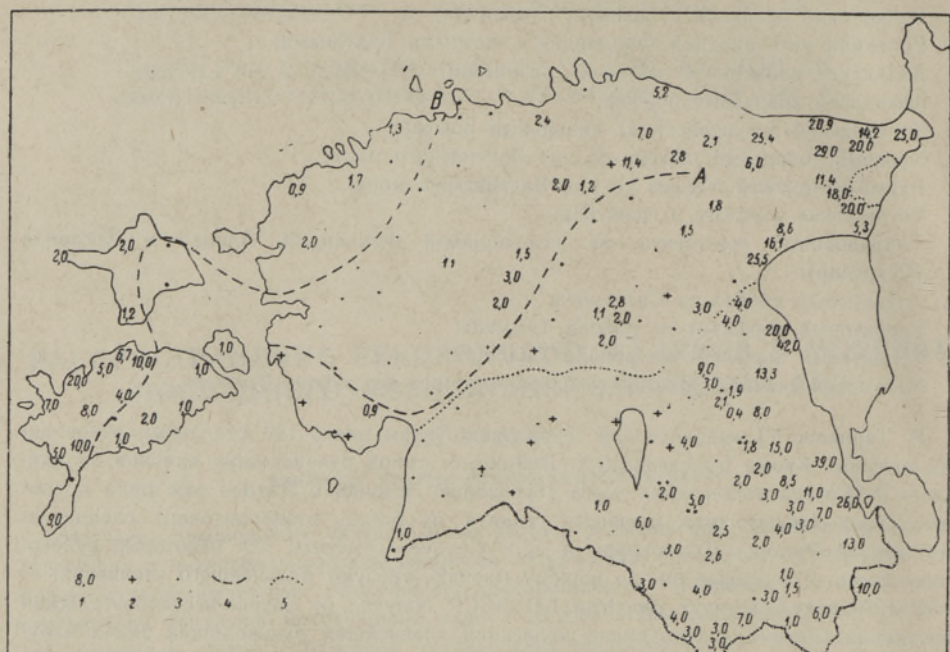
Рис. 1. Содержание рапакиви в галечной фракции морен последнего оледенения Эстонии. 1 — содержание в % от кристаллических пород; 2 — рапакиви встречаются в очень незначительном количестве или содержание их точно не установлено; 3 — пункты наблюдения, в которых рапакиви отсутствуют; 4 — границы стадияльных наступлений, более поздних, чем лужская, на основе изучения кристаллических пород в моренах. Буквой А обозначена граница невской стадии, буквой В — граница паливереской стадии; 5 — граница силура и девона.

В распространении отдельных подтипов имеются локальные своеобразия. Уже Х. Вийдинг [49] отметил, что зеленовато-серые и зеленовато-бурые рапакиви встречаются более часто в крайней восточной части республики, в частности на западном берегу озера Пейпси. Это подтверждается также нашими анализами. Ясную тенденцию к концентрации в более восточных районах республики имеют также пятнистые граниты.