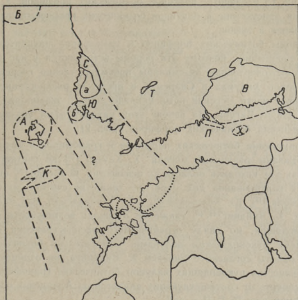
Рис. 4. Распространение руководящих валунов во время паливереской стадии последнего оледенения. Условные обозначения те же, что на рис. 2.

областью этих порфиров он указал дно Балтийского моря непосредственно к югу от Аландских островов, восточнее выходов бурых кварцевых порфиров, но на основе изучения валунов на острове Готланд он [33] передвинул их предполагаемые выходы немного к юго-востоку.