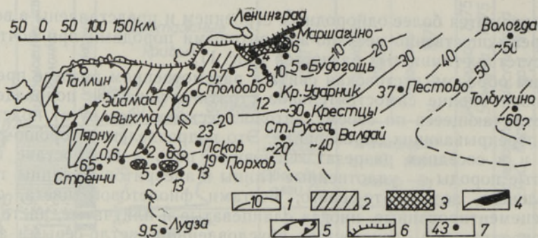
Рис. 2. Схема распространения и мощностей пестовской свиты. Условные обозначения: 1 — изопакхиты, 2 — район, где аналоги свиты не установлены, 3 — районы достоверного отсутствия свиты, 4, 5 — районы развития вероятных аналогов пестовской свиты — нижней пачки ладожской (4) и юлгазеской (5) свит, 6 — глинт, 7 — буровые скважины и мощности.

изучавших микрофитологические остатки рассматриваемых образований Московской синеклизы и пришедших к выводу о их вероятном позднекембрийском возрасте.